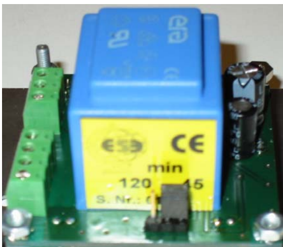
Abb. Jumper; hier eingestellt auf 45 Minuten

Hiefür ist der Jumper auf der Platine in die jeweilige Position zu bringen (siehe Abb.)